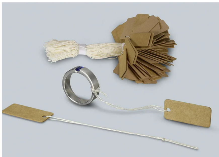
Neu von eXtra4 Labelling Systems: Etikett aus PEFC-zertifiziertem Karton mit naturbelassenem Baumwollfaden zur Auszeichnung von Schmuck und Uhren mit betont nachhaltigem Anspruch.

Sowohl Folie, als auch Klebstoff werden unter hohem Energieaufwand in chemischen Prozessen aus nicht nachwachsenden Rohstoffen hergestellt, sind häufig importiert und nicht vor Ort bezogen. Als Verbundmaterial lässt sich weder Etikett noch Produktionsabfall recyceln, sondern lediglich thermisch verwerten. Farben für Design und Datenaufdruck sind nicht lösemittelfrei oder wasserbasierend.