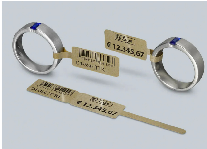
Öko-freundliches Schlaufen-Etikett von eXtra4 geeignet für Beschriftung im Thermotransfer-Drucker selbst mit Code und Logo-Daten.

Mit Beschriftungsflächen von 22 x 10 mm (BxH) und einer Schlaufe von 28 mm Länge bei 3 mm Breite entspricht es einer beliebten Standard-Form, sein Grundmaterial besteht allerdings zu 100% aus Altpapier. Es verleiht dem Etikett seine Recycling-Optik mit brauner Färbung und unregelmäßiger Struktur. Für zuverlässige Klebekraft sorgt ein permanent haftender Acrylat-Klebstoff, der frei von Lösemitteln ist.