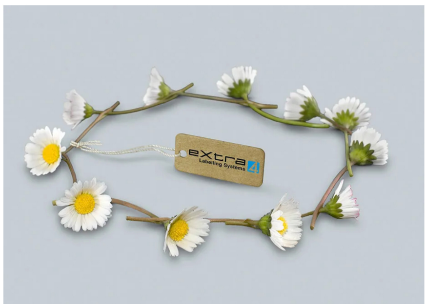
Oko-Etiketten für den Juwelier? Lösungen und Möglichkeiten von eXtra4 Labelling Systems.

08. Jun. 2022 08:07 · Katharina Brändle · BLICKPUNKT UHREN | SCHMUCK